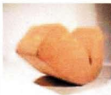
Neo Design - progetto Corky Lips

Tra i vari progetti che porto a Milano posso annoverare uno speciale, uno dei miei pièces de résistance , il puff/sedia a dondolo Corky Lips , un prodotto con una forte coscienza ecologica. Posso affermare che Corky Lips è la materializzazione di sensualità ed ecologia, essendo realizzato solo con scorza di sughero. Ho creato