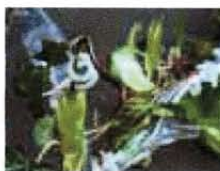
Az-e-mut - progetto Tutrix

contrario, grandi al punto da nascondere la pianta stessa. Allo stesso tempo, l'ispirazione per la sua realizzazione ci è stata offerta dalla natura, ovvero da un giardino