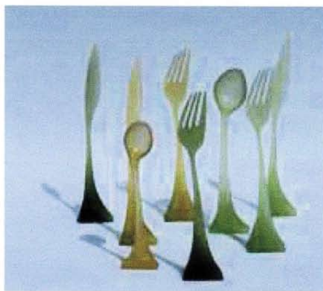
d-Vision - progetto Sunny side up

La nostra esposizione si chiama On the table - Outdoors e uno dei progetti in mostra è il set di posate Sunny side up , ispirato alla naturalissima tendenza alla cre-